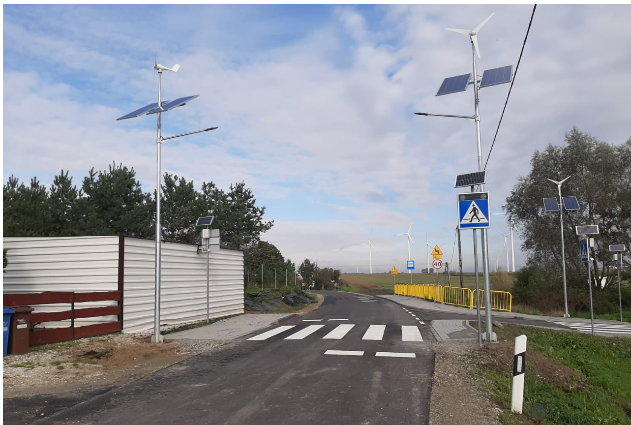
Fot. 3 Przebudowa drogi powiatowej Mgowo-Wiewiórki