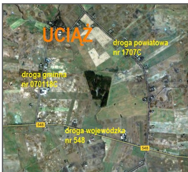
Miejscowość Uciąż 5

Uciąż zlokalizowany jest w obrębie trzech dróg: wojewódzkiej nr 548 wiodącej ze Stolna do Wąbrzeźna, powiatowej nr 1707C oraz gminnej nr 070118C. Przez centrum miejscowości przebiega droga gminna wzdłuż której znajduje się zwarta zabudowa mieszkaniowo – gospodarcza. Najbardziej charakterystycznym elementem architektury przestrzennej w Uciażu jest – zespół dworsko – folwarczny. W skład zespołu folwarcznego wchodzi: dwór murowany z ok. poł. XIX w. oraz park z poł. XIX w. o powierzchni 1,1 ha.