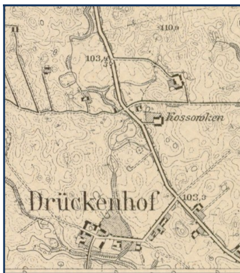
Mapa Uciąży z początku XX w. 1