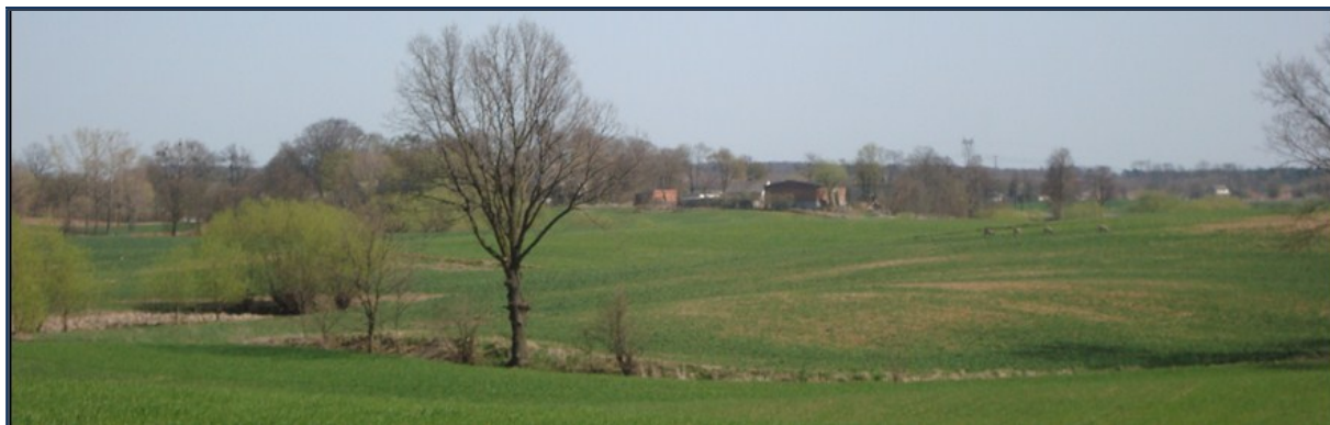
Widok na ośrodek majątku ziemskiego – folwarku Uciąż. Obecnie dwór i otoczony parkiem 6