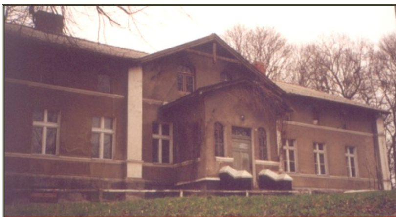
Dwór w Uciażu, ostatni właściciel Artur Lewin sprzedał go wraz z gruntami Pruskiej Komisji Kolonizacyjnej. Później przez ok. 90 lat pełnił funkcję szkoły 2