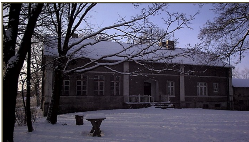
Dwór w Uciążu od strony parku 3