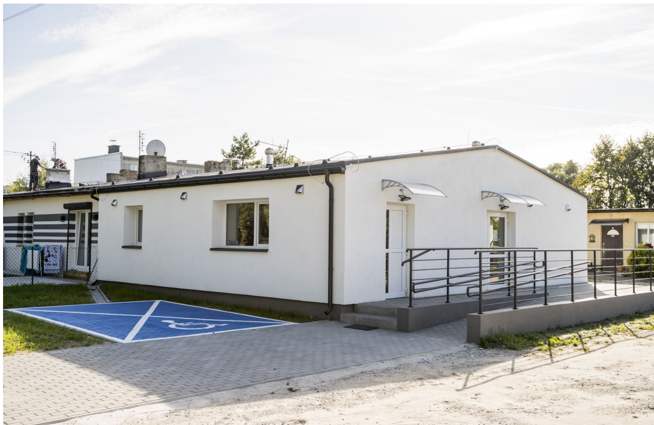
Fot. 5 Termomodernizacja i przebudowa świetlicy wiejskiej w miejscowości Józefkowo