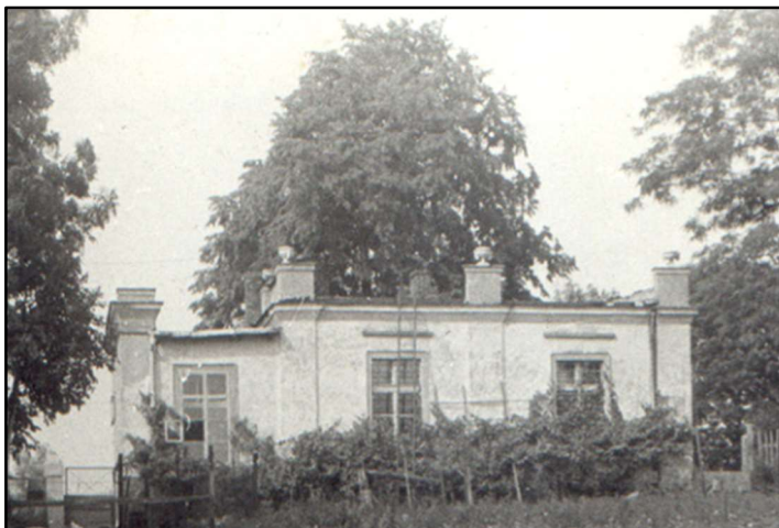
Karczma w Ostrowie

Wiosną 1890 roku pobudowano w Ostrowie szkołę powszechną jednoklasową, do której uczęszczało 35 tutejszych dzieci. Budowa kosztowała 12 500 marek. Wieś liczyła wówczas 144 mieszkańców i 27 domów. Według spisu ludności z 1931 r. zanotowano w Ostrowie 62 domy mieszkalne, 72 mieszkania i 466 osób. Po wojnie Ostrowo było jedną z sześciu gromad gminy Płużnica i obejmowało 1377 ha z 670 mieszkańcami. Kolejne zmiany administracyjne niewiele zmieniły obszar Ostrowa.